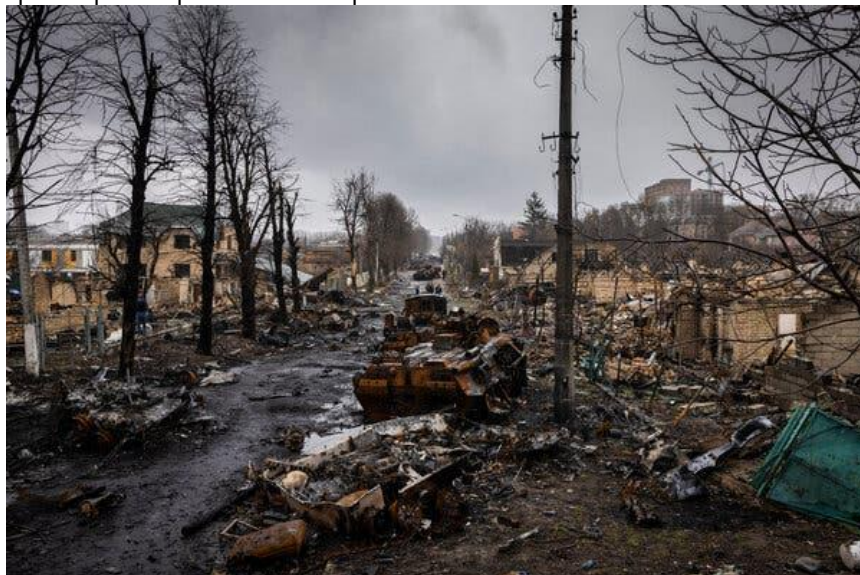
Destrucción generalizada en Bucha, Ucrania, el domingo, después de que las fuerzas ucranianas supuestamente atacaran un convoy ruso. Ivor Prickett para The New York Times - 18 de abril de 2022

Habiendo imaginado esto, ore por los desplazados en el mundo, personas para las cuales esta fantasía para usted, es una terrible realidad para ellos. Ore por su pérdida, su duelo y pida a Dios que esté con ellos. Ore también por su país, su tierra, su comunidad, que sean lugares de bienvenida para aquellos que han sido desplazados a la fuerza de sus comunidades.