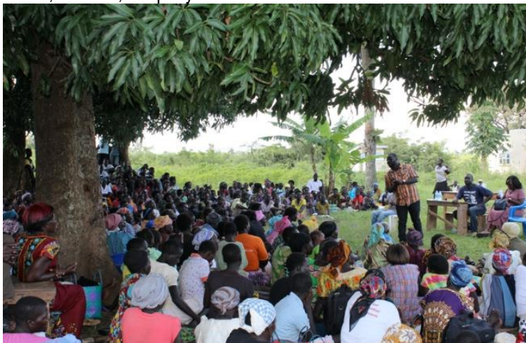
I Live Again Uganda, una ONG cristiana, lleva a cabo una sesión de atención a traumas, en una aldea ugandesa

Ore por los refugiados en los campos de refugio y en establecimientos urbanos difíciles a través de Uganda – por la restauración y provisión de Dios. Ore por paz para los países vecinos de Uganda. Los disturbios en muchos países africanos no salen tanto en las noticias como otros desastres y guerras, pero los desafíos son reales. De los aproximadamente 1.5 millones de refugiados en Uganda, más de la mitad de ellos, provienen de Sudán del Sur y más del 32% vienen de la República Democrática del Congo. Otros vienen de países como Somalia, Burundi, Eritrea, Ruanda, Etiopía y Sudán.